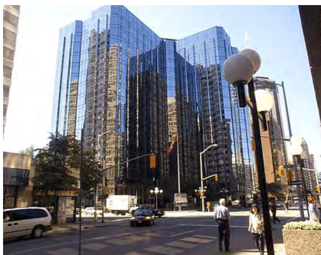
Centennial Towers / Tours Centennial on Kent Street / sur la rue Kent

Pour des raisons de sécurité contactez-nous avant de venir nous visiter.