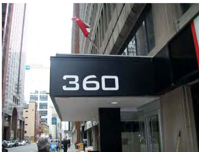
CMOS Office on Laurier Street West in Ottawa located on the 4th floor

Le but de la SCMO est de stimuler l'intérêt pour la météorologie et l'océanographie au Canada.