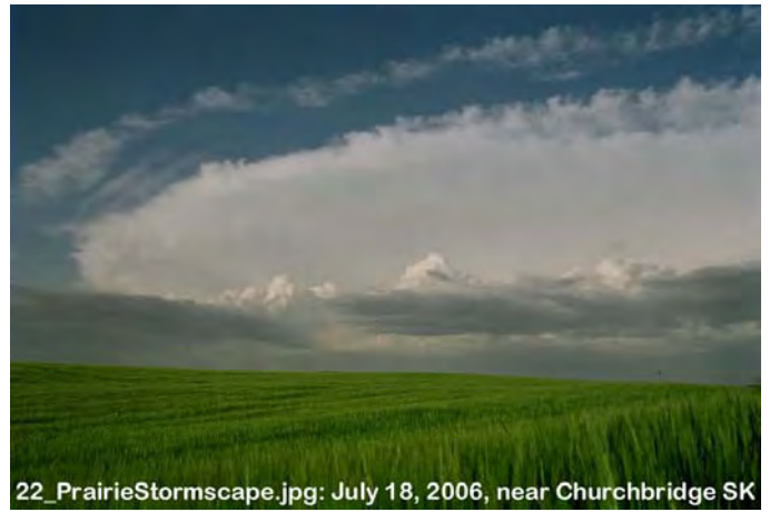
22_PrairieStormscape.jpg: July 18, 2006, near Churchbridge SK [David Sills] 2007 First Prize / Premier prix