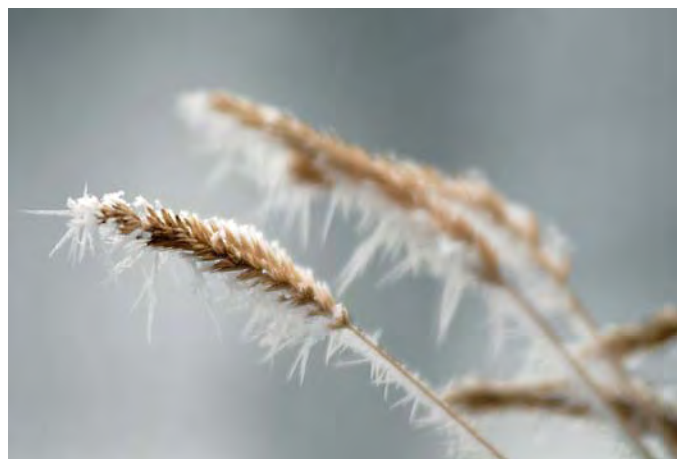
Rime on Grass by/par Gabor Fricska