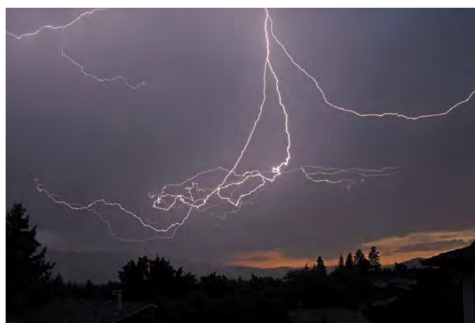
Lightning at Sunset by/par Gabor Fricska